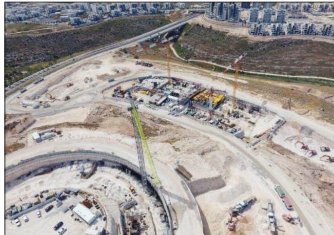
שכונת מורשת. תוכננה עם עירוב שימושים נרחב

”כי צוותי התכנון שהיו או כשתכננו את מודיעין עבדו על פי מודל של אורנים, מה שאפיינ את הבניה בארצות הברית בשנות הש- בעים עם התרחבות הפרוורים. לא היה כמובן עירוב שימושים, ולכן יש שכונה שהיא רק של מגורים ויש אזור שהוא רק של מסחר. הדעיון שהנחה את המתכננים היה שלא מערבבים אלה באלה. לכן כשאתה נוסע היום בעיר ורואה שדחובות דומים אחד לשני, ולכן גם יש בעיר